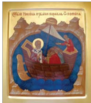
Икона Николая Чудотворца (редкий сюжет)

Святой апостол и евангелист Иоанн Богослов занимает особое место в ряду избранных учеников Христа Спасителя. Главная особен-